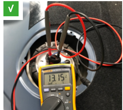
Abb. 2: elektrischer Steckkontakt am Deckel des Kraftstofffördermoduls

Bei modernen Fahrzeugen, die mit einer „geregelten“ oder „bedarfsgerechten“ Kraftstoffversorgung ausgestattet sind, wird die Kraftstoffpumpe durch ein eigenes Steuergerät mit einem pulswerten modulierten Signal angesteuert. Zum Testen solcher Systeme reicht ein herkömmliches Digitalmultimeter nicht aus, da man hierbei nur den Mittelwert der Spannung über eine Periode misst. In diesem Fall benötigen Sie ein Oszilloskop.