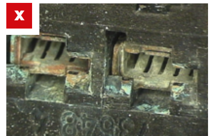
Abb. 5: Korrosion an den Kontakten